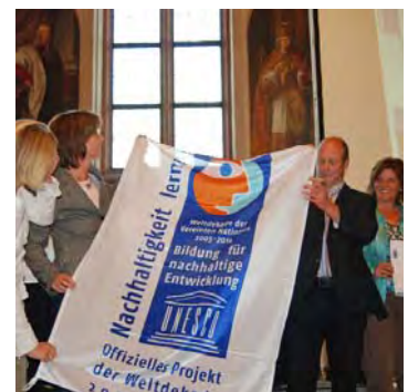
Auszeichnung Bildungsraum GrünGürtel