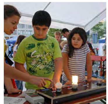
Klimagourmet bei „21 Tage Zukunft“