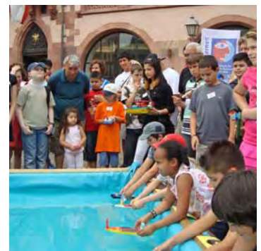
Solar-Rennen der Frankfurter Schulen