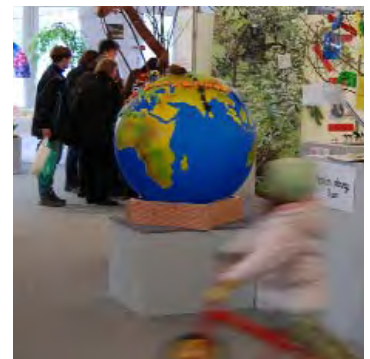
Schulprojekt Biodiversität Palmengarten