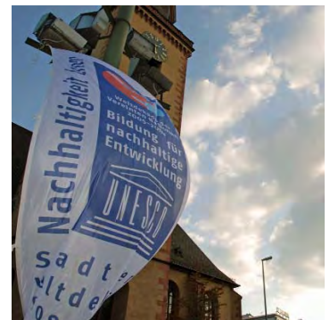
Aktionstag MainKlima Hauptwache

Bei der Ausstellung „Klimagourmet“ konnten Besucher die Themen Treibhauseffekt, Wahl der Lebensmittel, Produktionsaufwand und Transport durch verschiedene Mitmachobjekte erfassen. Die Ausstellung wurde vom Büro „glückundstiefel“ im Auftrag des Energiereferats entwickelt. Sie wurde im Rahmen der Veranstaltungsreihe „Frankfurt isst gut“ präsentiert und anschließend an zahlreichen Orten gezeigt. Umweltlernen in Frankfurt hat die Klimagourmet-Ausstellung für die Zielgruppe weiterführende Schulen zu einer Lernwerkstatt erweitert.